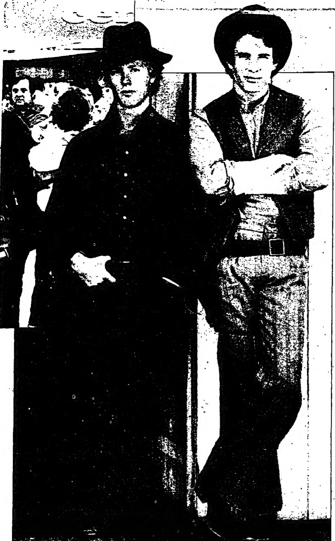
وليام كات وتوم برجر كما ظهرا في (بوتش وسندانس).

خولة لاسرائيل وزارة المواصلات مراقب السير على الطرق لواء القدس والجنوب جيش الدفاع الاسرائيلي قيادة منطقة الضفة الغربية ضابط شؤون المواصلات مراقب السير على الطرق اعلان عن ترتيبات خاصة لحركة السير في القدس وفي الطرق المؤدية لها يوم الثلاثاء ٣٠-١-٨٠ بمناسبة مسيرة القدس